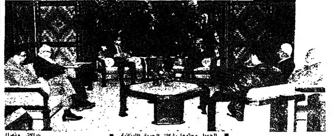
الجميل مجتمعا برلمان الجبهة اللبنانية (الاربعاء)